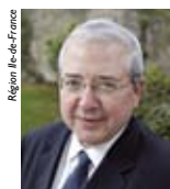
Jean-Paul Huchon , président du conseil régional d'Ile-de-France.

La région Ile-de-France croit en l'efficacité de l'économie sociale et solidaire. Nous voulons que ce secteur se développe et soit encore mieux connu du grand public ainsi que des porteurs de projets. C'est pourquoi je suis très fier que la région soit partenaire de ce guide pratique. Le lecteur y trouvera notamment tous les outils mis en place ces dernières années, comme le fonds d'investissement pour financer de nouveaux projets de « start-up solidaires » [voir page 99]. Avec la création récente de l'Atelier-Centre de ressources régional de l'économie sociale et solidaire, la région réaffirme que ce secteur est une voie de développement économique à part entière, à la fois alternative et concrète.